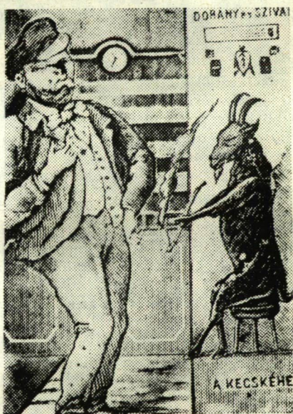
SUHAJTÁS KÖDVÁGÓ ILLÉS HELYBELI CZUCZILISTA

Ugyancsak Szigethy a megteremtője a családi élet intimitásait kifecsegő Böske szobalány alakjának.