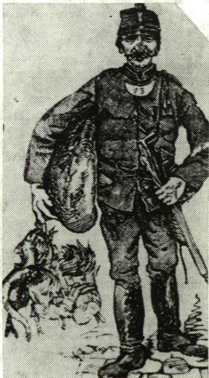
LÓRINC, A VÁROS CSELÉDJE

Amikor az egész ország zúg, zajong az ezredforduló ünnepségei között, Szeged demokratikus nagy tunyaságában, ami pénzbe, fáradságba nem kerül, azt kínálja föl a programok közé.