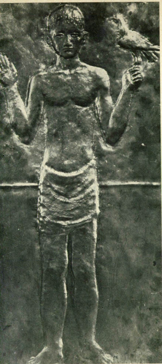
SAMU KATALIN MUNKÁI