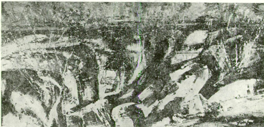
FONTOS SÁNDOR: HAVAS TÁJ