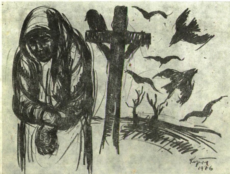
KAJÁRI GYULA RAJZA