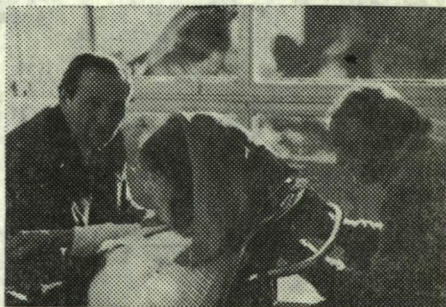
KODÁLY ZOLTÁNEKNÁL GALYATETŐN

Emlékszel biztosan egy interjúra, amelyben a fiatal rendező azt nyilatkozta, hogy a kispolgárságnak akar színházat teremteni. Itt és most! Ebben a társadalomban! Jó, akarja ezt, hiszen egyénileg megteheti. De miért nem kérdez vissza senki, hogy „Kérem szépen, miért tetszik ezt csinálni?”. „És kinek az érdekében tetszik ezt csinálni?”