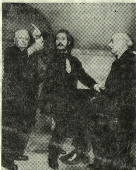
KOSSUTHKÉNT KISFALUDI STROBL ZSIGMONDDAL ÉS ILLYÉS GYULÁVAL

Az én nemzedékem nagy hittel indult ezen a pályán, s azzal a reménnyel, hogy mi fogjuk pótolni azt a késedelmet, amennyivel a magyar színház elkésett az európai időszámítástól. Nem volt ez oktalan remény. Itt volt ez a harminc-valahány év, amelynek az első részében óriási dolgok történtek a színházi világban. Bármilyen furcsán hangzik: a legnehezebb helyzetben történtek a legnagyobb szerűbb dolgok. Egy-egy bemutató erkölcsi, szellemi, nemzeti erőpróbát jelentett. Különösen a magyar írók bemutatása Dobozytól kezdve, Darvason át Illyésig és Németh Lászlóig . Olykor szinte reszketett a levegő. Mert együtt lendültünk föl az íróval, együtt gondolkodtunk, s tudtuk, hogy akkor tisztán gondolkodni annyit is jelent, mint mást gondolni.