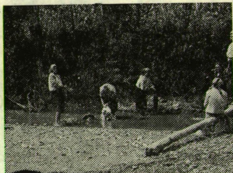
MOSÁS A PATAKBAN

Az 1324-ben megszületett Havasalföld és 1352-ben létrejött Moldova vajdaságai előtt a terület a kun nép országa, Kunország (Kumánia) volt. A kun hadsereg 1071-ben, 1082-ben, 1093-ban és 1195 táján Magyarországra tört, de a magyar királyok mind a négy alkalommal kiűzték őket. A magyar király a veszélyeztetett határ védelmére 1211-ben Hermann de Salza nagymester német lovagrendjét telepítette, nagy kiváltságokkal látta el őket. A lovagok azonban egy Magyarországtól független kis német államot akartak itt létrehozni, és ezért II. Endre magyar király 1225-ben a lovagrendet kiűzte. Helyükbe, határvédelemre magyar őrséget telepített. Ez a Kunországba telepített magyar határorcsoport a Moldvában ma is élő csángómagyarság legelső ősi csoportja.