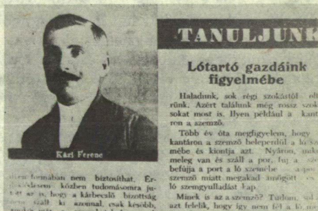
KAZI FERENC CIKKE ÉS FÉNYKÉPE A MAGYAR FÖLDEN

Az unoka arról is tud, hogy nagyapja burokban született, és a burok egy darabját talizmánként, zacskóba varrva a nyakában hordta. Ott volt Przemysl védői között, megsebesült és fogságba esett. A talizmán védő hatásában többé nem bízott, el is dobta, de a zacskót megtartotta. Az Uralban bányában dolgozott, onnan egy darab rezet ebben a zacskóban hozott haza. Elbeszéléseiben sokszor említette Murmán -t. Hegedült, citerázott, verset is írt, és visszaemlékezésésként vetette papírosra a fogságban eltöltött éveket.