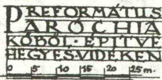
KÓS KÁROLY RAJZA