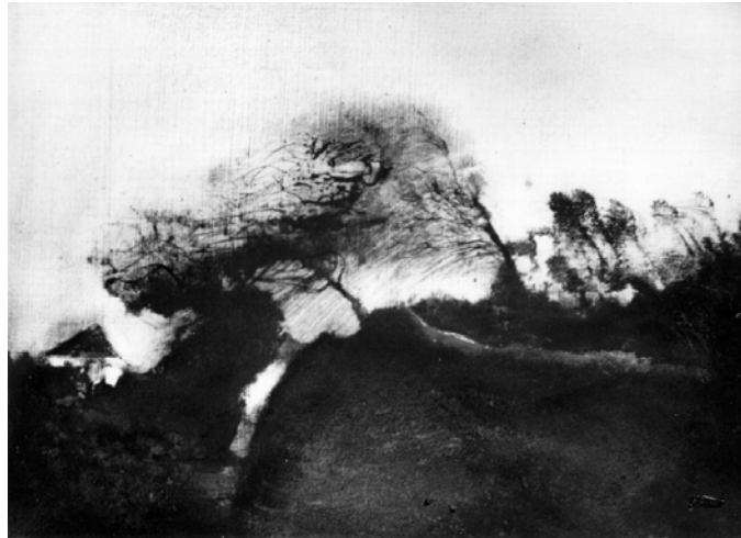
PATAKI FERENC: MINDIG SZÉLBEN (1981)