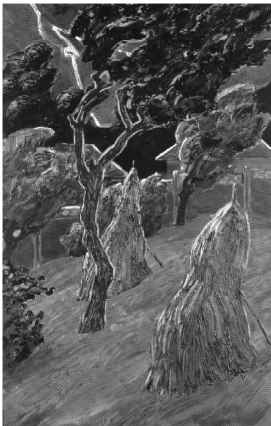
TENK LÁSZLÓ: VIHAR LÁPOSON