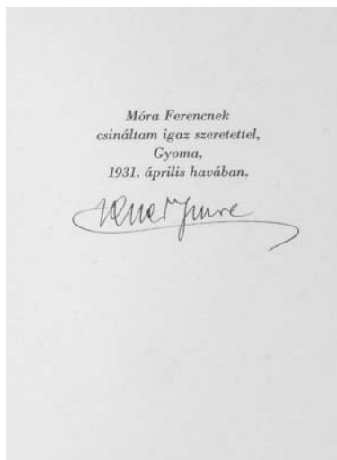
AZ UTOLSÓ SUBA AJÁNLÁSA

A példány, amelyről a fenti leírás készült, ma a szegedi múzeumban található s Móra saját példánya volt. A további kb. 15 példány, amelyeket nem