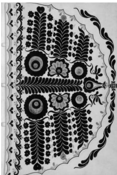
AZ UTOLSÓ SUBA CÍMLAPJA

vallotta, az unoka számára állított emléket a dédapáról; a nyomtatott írói szó erejével teremtve presztízst az alacsony sorú, ún. egyszerű ember köré. (Veje fölmenői ugyanis Móra Mártonhoz képest előkelőek voltak.)