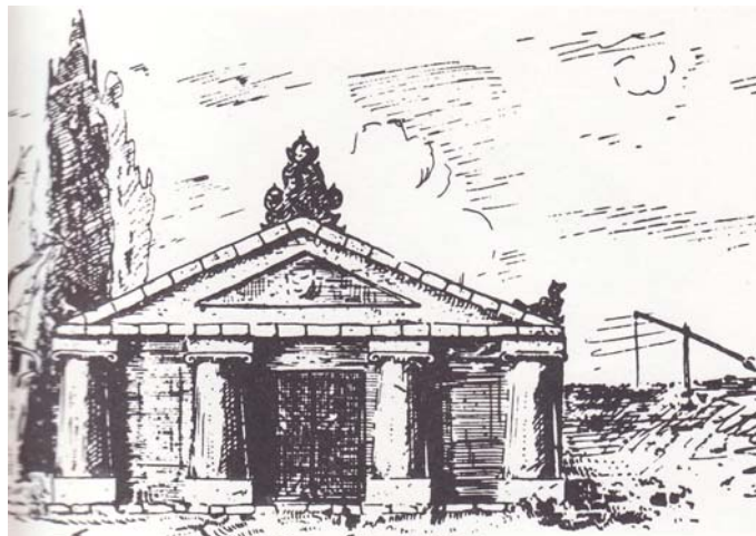
A PARASZTSZÍNHÁZ HOMLOKZATA

1892 körül gondolt egy merészet és példanélküli vállalkozásba kezdett. Birtokán először ideiglenes, majd időt állóbb parasztszínházat építtetett, ahol a környékbeli parasztok görög illetve más klasszikusokat adtak elő, a magyar és külföldi értelmiségiek, vendégek előtt. Justh hitt abban, hogy a romlatlan parasztság vissza tudja adni a klasszikus görög (Szophoklész) és római (Plautus) darabok vagy akár Shakespeare, Molière színdarabjainak az egyszerű népre jellemző érzéseit, gondolatait, mozdulatait. Természetesen Justh a saját alkotásait ( Hárman voltak , Siralomház , Asszony szava , Isten szava , Agglegény vőlegény , Megmutatom, hogy kell ) is játszatta valamint Czóbel Minka Déliabáb című darabját, illetve Tóth Edének A falu rossza című közismert népszínművét. Közel negyven színészének nevét ismerjük. A legkiválóbb színésznő Molnár Jánosné Zalai Júlia volt, Justh szerint is „ olyan nagy talentum, amilyen a maga nemében, ki merem mondani, Pesten is kevés van. ”