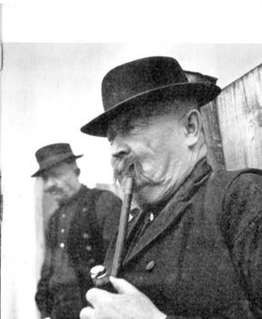
NAGYGAZDA (NÓGRÁD MEGYE)

„Kulák” asszonyok ( Nógrád m. ); Nagygazda ( Nógrád m. ) – mondják szó szerint a következő képpár címei. A mai néző-olvasó gondolkodóba esik. Ki adhatta a címeiket? Az etimológiai szótárból tudjuk, hogy az orosz eredetű „kulák” fogalom 1926-ban bukkant fel első ízben a magyar nyelvű publicisztikában ( Új Március , 2. sz.). Müller alkalmazta itt ezt, vagy Ortutay? Nagy valószínűséggel inkább az utóbbi, mert ez a fogalom felbukkan a tanulmányban is (7. p.). Használata a jelenből visszapillantva, a közelmúlt történelmének ismeretében némileg hátborzongató.