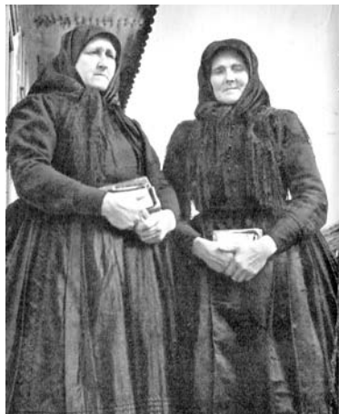
„Kulák” ASSZONYOK (NÓGRÁD MEGYE)