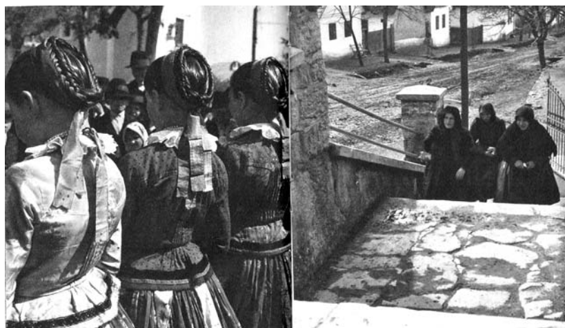
VASÁRNAP DÉLELŐTT (AJAK)

Az első oldalpáron lévő két kép fő alkotóelemei együttesen képeznek egy nagy „háromszög-kompozíciót”, olyan formai megoldással, hogy (apró „töréssel”) a háromszög két „befogóját” a két képen látható házak egy-egy homlokzatzáró vonala jelenti. – Figyelő (Pest megye); Rétközi parasztház . Szerkezetileg elég fondorlatos, ugyanakkor formailag látszólag nagyon egyszerű megoldás; végül is „csak” két ház homlokzata szerepel egymás mellett – a kettő együtt azonban teljesen kiegyensúlyozott formarendet testesít meg. A képi elemekből épített rend összességében nyugalmat, mintegy örökérvényűséget sejtet. Ki lehetett a rendet teremtő tettes? Volt külön művészeti tervezője a könyvnek? Vagy a fotográfus helyezte egymás mellé a képeket?