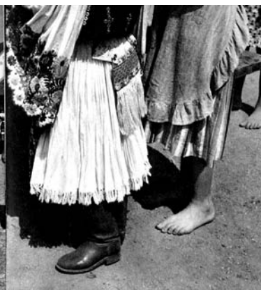
A MÁSIK MEZŐKÖVESD