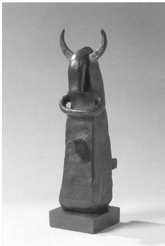
JAKOVITS JÓZSEF: KÚT (BÁLVÁNY)