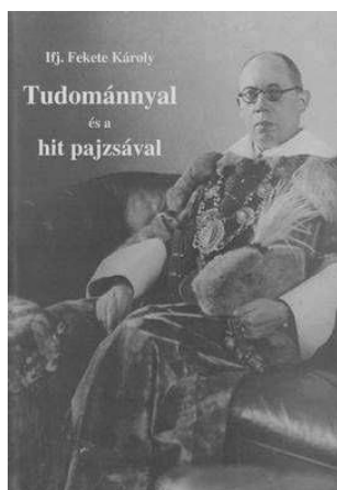
Erdélyi Református Egyházkerület Kolozsvár, 2008 175 oldal

Ifj. Fekete Károlyban a Makkai-centenárium debreceni és kolozsvári alkalmi mélyítették el azt az elhatározást, hogy „a XX. századi magyar egyház- és teológiatörténet méltatlanul feledésre ítélt, kulcsfontosságú alakjának” a munkásságát feltárja.