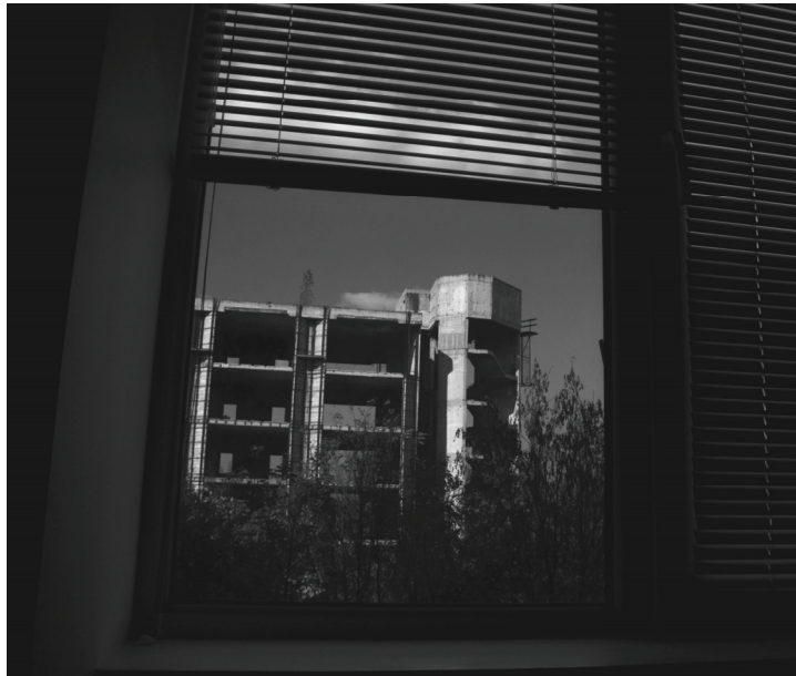
DÖMÖTÖR MIHÁLY: SUMENI EGYETEM I.