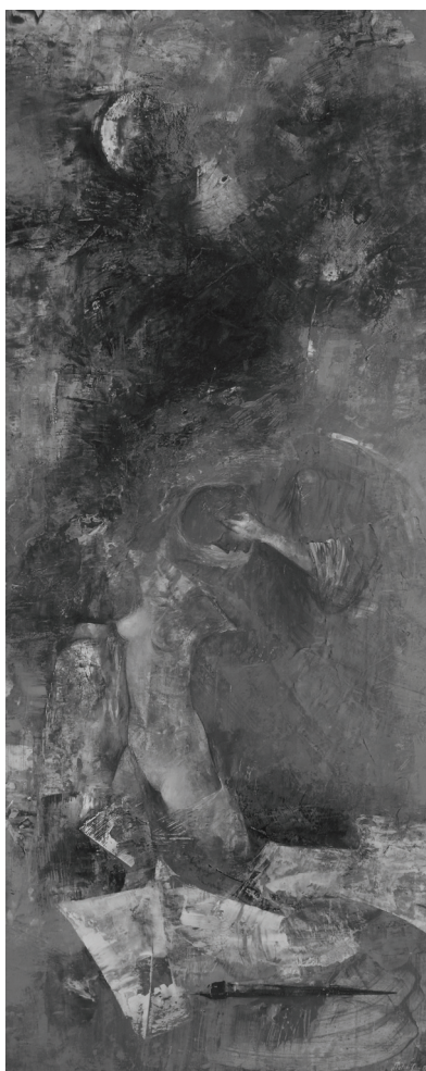
PATAKI FERENC: AZ ALKOTÁS GÉNIUSZA (1992)