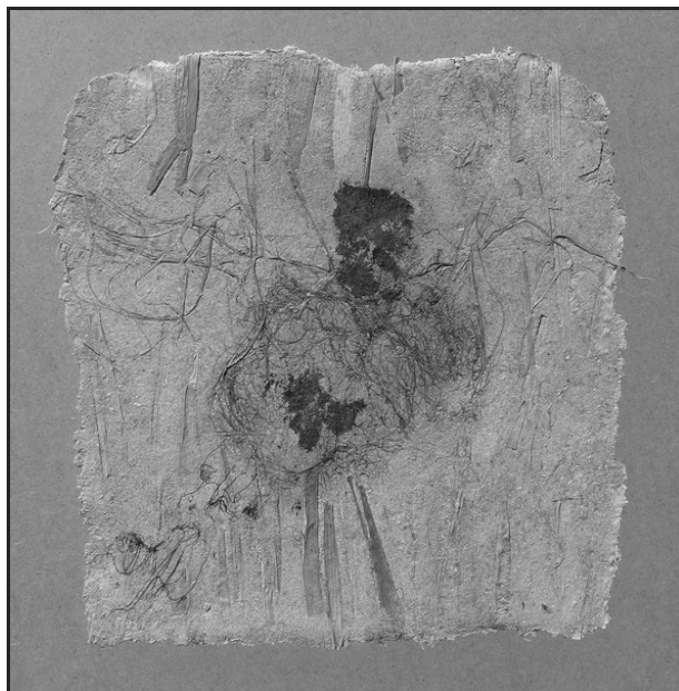
SINKÓ JÁNOS: METAMORFÓZIS II.