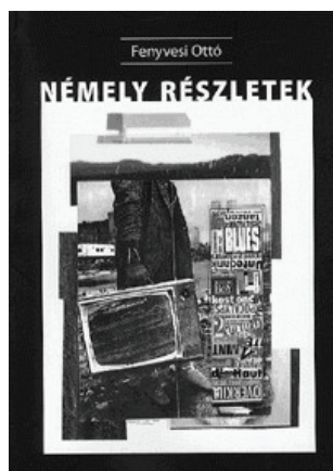
Universitas Szeged Kiadó Szeged, 2009 220 oldal, 2490 Ft

FENYVESI OTTÓ: NÉMELY RÉSZLETEK. FELJEGYZÉSEK, CÉDULÁK, BEMÁSOLÁSOK, VIZUÁLIS FRAGMENTUMOK