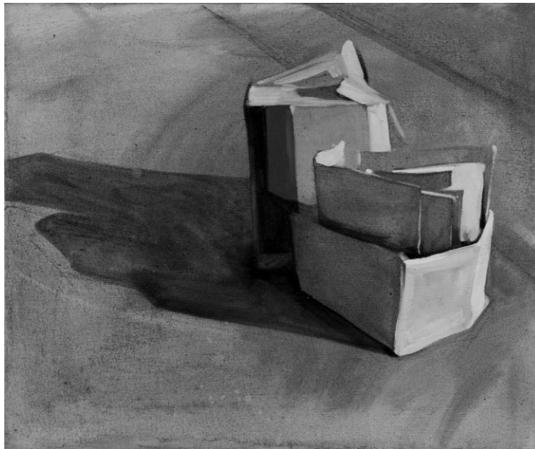
SZABÓ FRANCISKA: UTCA