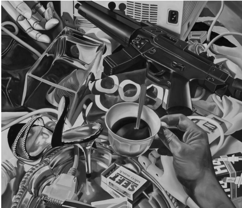
LAKATOS ERVIN: LATE IN THE DAY I.