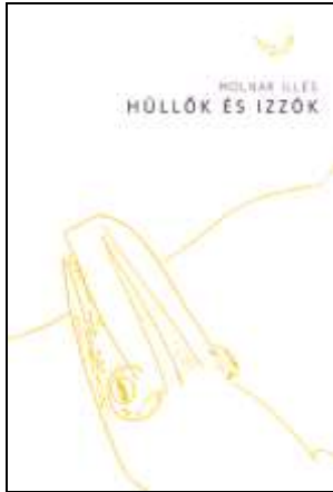
Fiatal Írók Szövetsége Budapest, 2013 1600 Ft