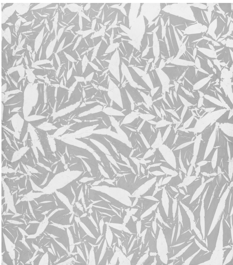
HANTAI SIMON: ETUDE (ETŰD), 1968, olaj, vászon, 230×203 cm, magángyűjtemény.

A látomások és az ekstázis mellett olyan – a beavatás szempontjából központi – elemek is hangsúlyt kapnak az eddig említetteken túl a kötetben, mint az áldozás, a dobok (lehetővé teszik a sámán és a lelkek számára az utazást), a tükör (tükörbe nézve a sámán megláthatja a Másik világokat) vagy a barlang (a túlvilágra való átlépés vagy az alvilágjárás konkrét szimbóluma). Sirokai költői nyelvét tehát ekstاتikus látomásossága konstruálja meg. Az ekstázist megelőző eufória pedig Eliade szerint is az egyetemes líra forrása.