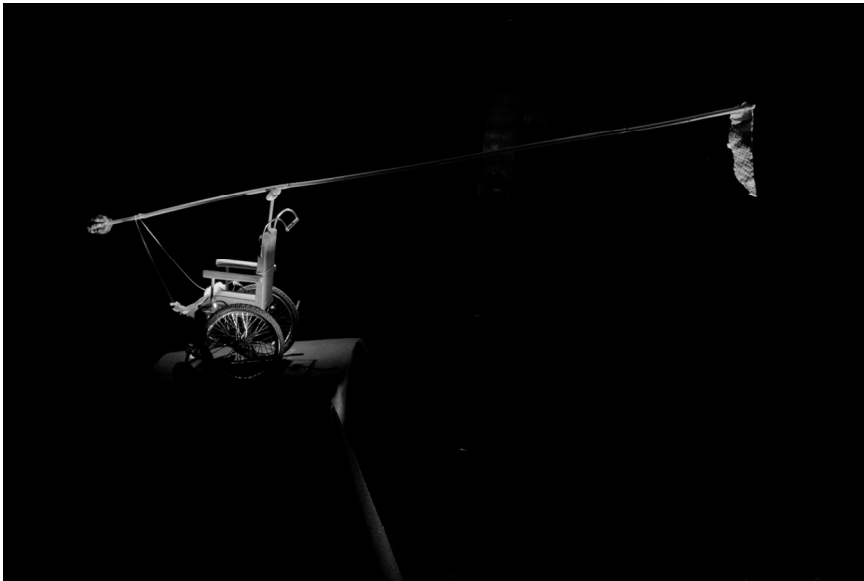
Perovics Zoltán: Artopéd balansz , 2011, fotók: Tóth Balázs Zoltán

„Nádszál az ember, semmi több, a természet leggyengébbike; de gondolkodó nádszál. Nem kell az egész világmindenségnek összefognia ellene, hogy összezúzza: egy kis pára, egyetlen csepp víz elegendő hozzá, hogy megölje. De még ha eltaposná a mindenség, akkor is nemesebb lenne, mint a gyilkosa, mert ő tudja, hogy meghal; a mindenség azonban nem is sejti, hogy mennyivel erősebb nála.” 6