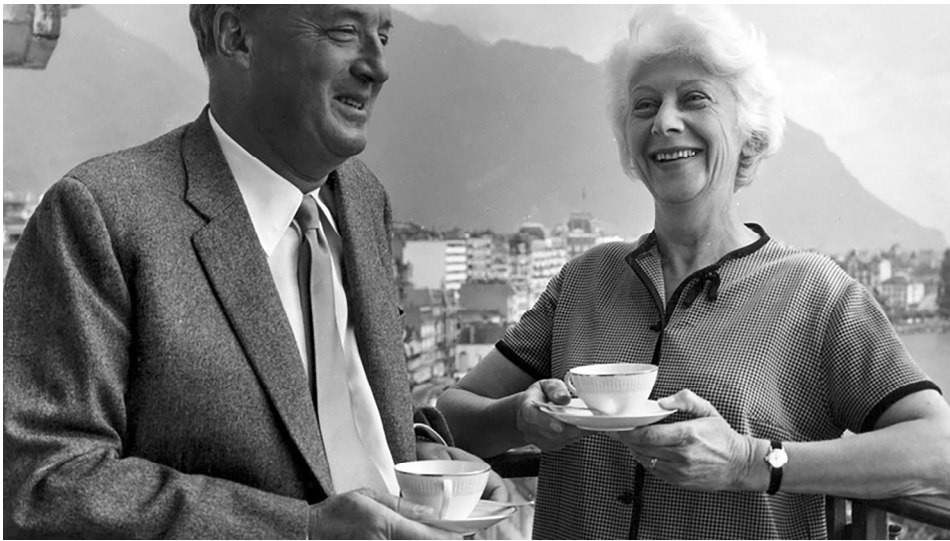
Gyakran érzem úgy, hogy kellene egy speciális tipográfiai jelölés a mosolyra – valamiféle homorú jel, egy hanyatt fekvő kerek zárójel. (Nabokov egy 1969-es interjú során)

A káprázatbeliek ugyan rálépnek az útra, „ami a digitális világból való felébredéshez vezet” (V.2.) küldetésük sikere végig kérdéses marad. Hiába a kozmosz vallásos lüktetése vagy az alkotó megtalálásának ígérete, csak a sötétség és az üresség észlelhető. Mi van akkor, ha az emberiség valóban elhagyja a Földet és az általa ismert világ megszűnik létezni? Vajon képes-e az idegenben megtalálni önmagát úgy, hogy a viszonyítási pontok is értelmüket veszítették? „Nem érthetjük meg önmagunkat, mert ha a kutatás tárgya és végzője ugyanaz, akkor közösek a határaik is” (V.3.) A kötet végére Sirokai eljut a madáchi úrmagányhoz, ahol a növényi intelligencia birodalmától távol leginkább az üresség abszolútuma dominál, az egykori Első Föld asztronautái pedig kételkedni kezdenek abban, hogy a leggyorsabb hajó leküzdheti a távolságot köztük és alkotójuk között.