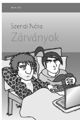
Apokrif-FISZ Budapest, 2015 426 oldal, 1600 Ft