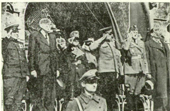
HAJTOVICS EZREDES, DENES LEÓ ÉS A SZOVJET VENDEG TÁBORNOK