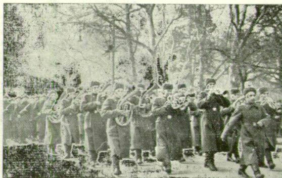
EGY SZOVJET KATONAZENEKAR FELVONULÁSA, 1944