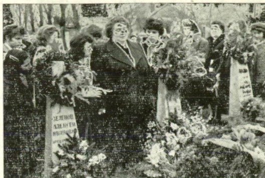
EGY SZOVJET ÉDESANYA FIA SÍRJÁNÁL, SZEGEDEN

Megjelent a Délmagyarországban a Nemzeti Parasztpárt föld-reform javaslata és Révai József cikke a Nemzeti Bizottságok földatairól.