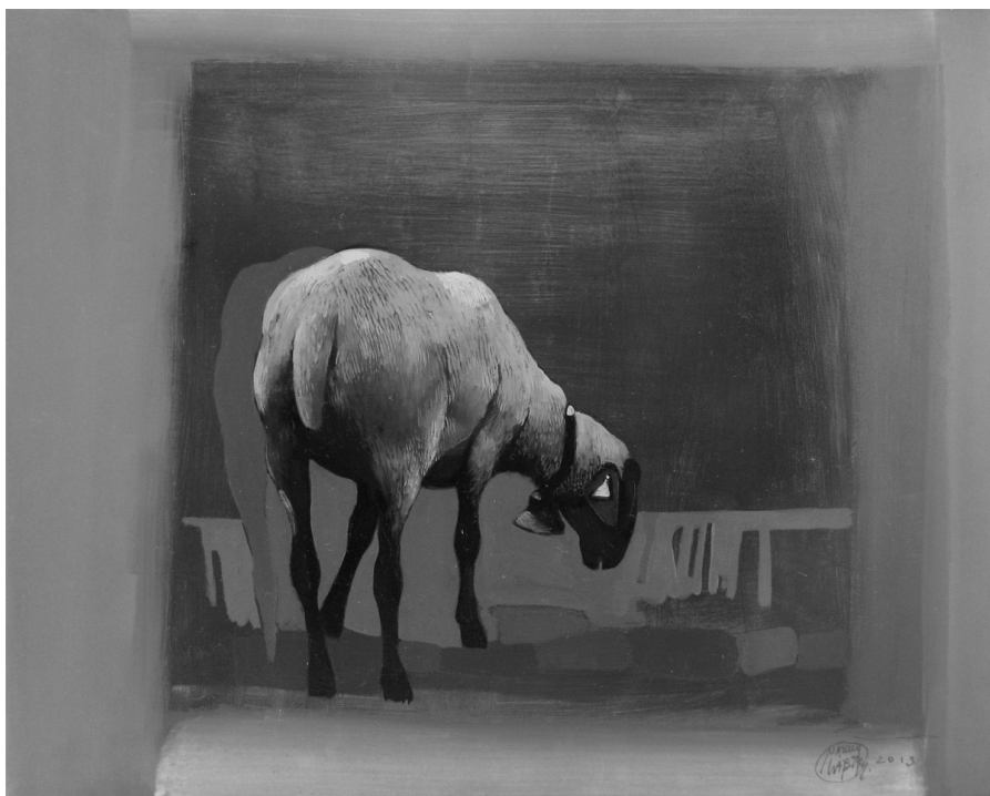
VÖRÖS ISZAP. 2013. OLAJ. FA.30×24 CM

ban elmondható: a prózapoétikai megoldásokat illetően kevésbé következetes, a gondolati tartalmat tekintve obskúrus. Bizonyos fejezetek reflektáltak szólnak az ellenség démonizálásának lélektanáról, felmutatják a háborús létállapot paradox jellegét, a frontvonal otthonosságát: „Tanuljuk a gyűlöletet, mert ez a túlélés egyedüli módja, gyűlölet segítségével lehet fölébreszteni azt a haragot és erőt, ami életben fog tartani, amitől kedved támad élni.” (96.); „Ez az utca első háborús évem őshazája. Itt találtam rá a rejtett békére.” (118.) Másból azonban zavarba ejtő kijelentéseket olvashatunk a háború felszabadító erejéről: „Ó, a háború édes gyöngédsége, melytől majdnem felrobban a szívem! Megváltás ez a háborús ég, Van Gogh okker csillagaival, mely ráborul az ismeretlen utca iránti szerelmemre.” (119.); „A háború károsnak megvan a maga mélyebb értelme, megszűnnek a határok, minden elszabadul, és ebből új valóság fakad: az emberi test és a gondolatok határtalan szabadsága.” (80.) A kötet nyugtalanító ellentmondásai újraolvasásra, a múlt megrázó eseményeinek újragondolására sarkallnak.