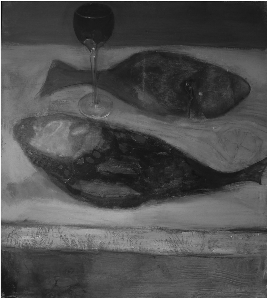
CSENDÉLET KÉT HALLAL ÉS EGY POHÁRRAL, 80×90 CM (AKRIL, VÁSZON) 2016.

Ha azonban ezeken túlteszi magát az olvasó – márpedig érdemes túltennie –, akkor a könyv nagyon izgalmas olvasmánnyá válik. Egy gyerek, majd kamasz és fiatal felnőtt szemével látjuk végig a diktatúrát, annak emberi és ökológiai viszonyait, hétköznapi élethelyzetét, életlehetőségeit. Csupa olyan helyzetet, melyek egy része a határ innenső oldaláról is ismerős lehet, hiszen a nyílt beszéddel itt is komoly problémák vannak.