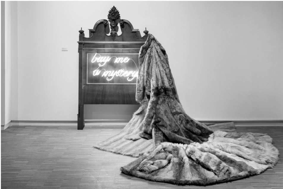
Apparatus 22: Vegyél nekem rejtelmet (2015), ©Apparatus 22, Ovidiu Șandor Gyűjtemény

Bari Károly nagy művész és igaz ember, a szó eredendő értelmében. Létértésünk most egy vékony, de súlyos kötettel lett gazdagabb.