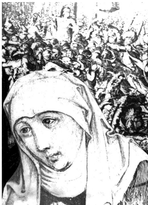
...Gondoljunk Kumria rác apácára (Anno)