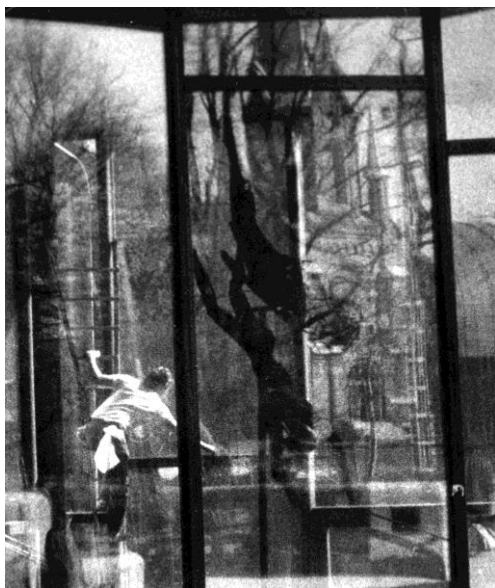
...Szerintem elég annyi, hogy – Isten hozta nálunk!