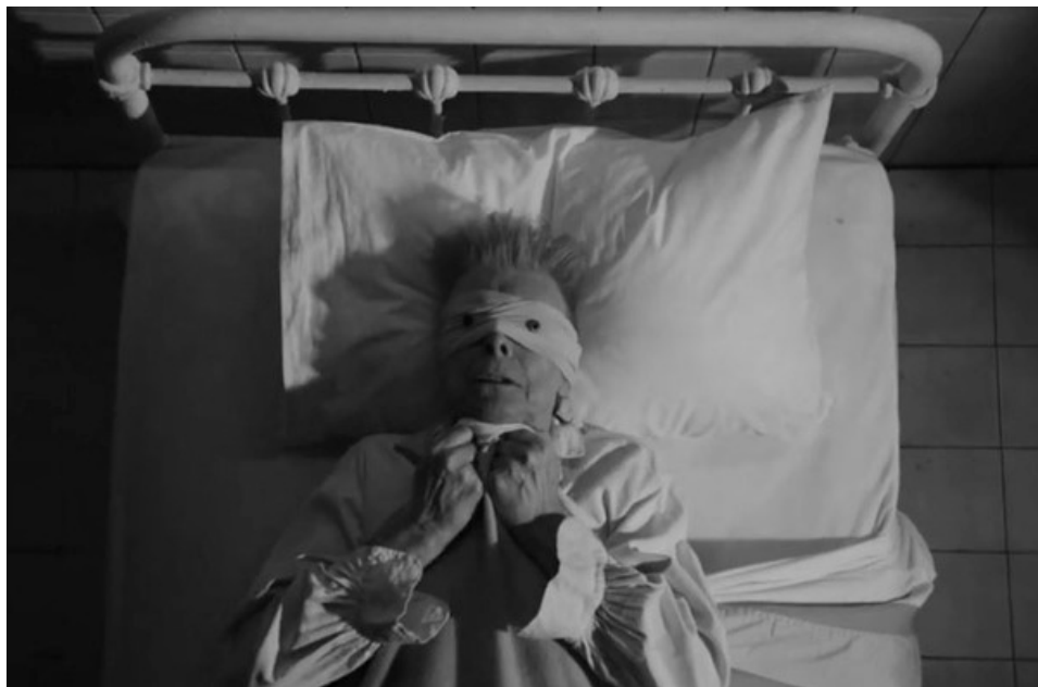
Részlet David Bowie Lazarus című videoklipjéből (2016, Rendezte: Johan Renck)

A Blackstar újabb alakváltást hozott David Bowienál, melynek a halál közelsége különös hangsúlyt ad. A dalok szövegéből kiderül, hogy saját magát azonosítja a Blackstarral (I'm a Blackstar), vagyis ő maga a halált hozó és a haldokló is. A pálya végét és az arcképcsarnok magára zárulását jelenti az utolsó két klip, melyek a saját halál színreviteleként, halálballadáként, haláldalokként foghatók fel. A két utolsó klip főszereplője egy lekötött szemű énekes, akinek a szeme helyén egy-egy gomb van.