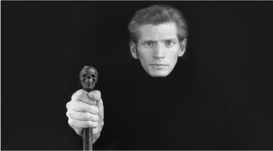
Robert Mattlethorpe: Őnarckép , 1988

Hasonlóképpen idézi fel a két klipben David Bowie is a saját pályájának egy-egy jellegzetes figuráját, jellegzetes gesztusait – a halál előtt utoljára számot adva saját életéről, saját magáról, és egyszersmind tovább is írva saját mítoszát, Major Tom, Ziggy Stardust, a Starman mítoszát. Az emberét, akinek a világűr az otthona – vagyis nem meghal, hanem csak eltávozik, hazatér. A Blackstar című klip furcsa és groteszk világa nem annyira a halál komolyságát idézi fel, hanem egy kissé groteszk világot. Olyan emberekkel, akiknek farkuk van, vagyis valamilyen gyanús módon mégis közük van az állatvilághoz, és furcsa szertartásaik vannak, furán rángatóznak, és istenként tisztelnek egy koponyát. A klip megidézi, de egyazon gesztussal ki is figurázza a szakralitás dimenzióját, rámutat Major Tom halálára, de azt is sugallja, hogy semmi baj, a Starman Blackstarként tovább él a csillagok között. És fűtyül a halálra.