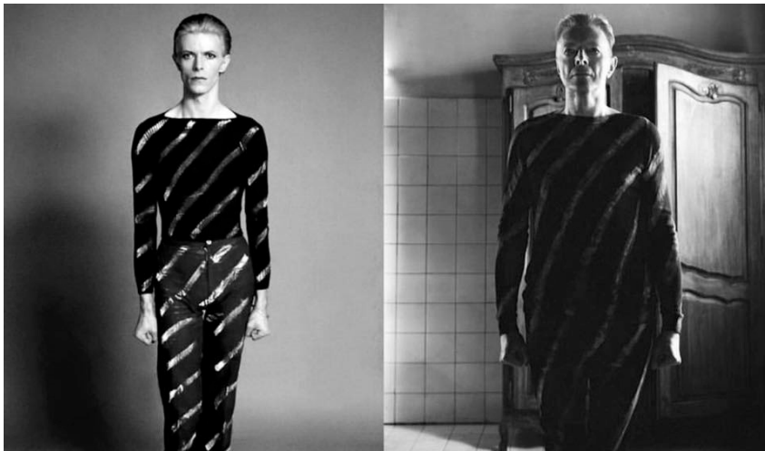
David Bowie egy 1970-es évekbeli fotón és a Lazarus című dalhoz készített klip egy jelenetében

Hasonló scenírozás figyelhető meg a Lazarus ban is; az ágyban fekvő, haldokló, lekötött szemű figura saját haldoklását viszi színre, amikor egyszer csak (1:58-nál) a dráma átvált feszesebb ritmusra, és a bohém fiataikor elevenedik meg. A haldokló ágya melletti szekrényből kilép az idős David Bowie ugyanolyan csíkos ruhában, melyet fiatalon viselt, és mosolyogva, táncolva mesél fiatakoráról. Közben a lekötött szemű figura azt énekl, hogy „oh, I’ll be free /Just like that bluebird” – a boldogság kék madarának romantikus motívumára utalva.