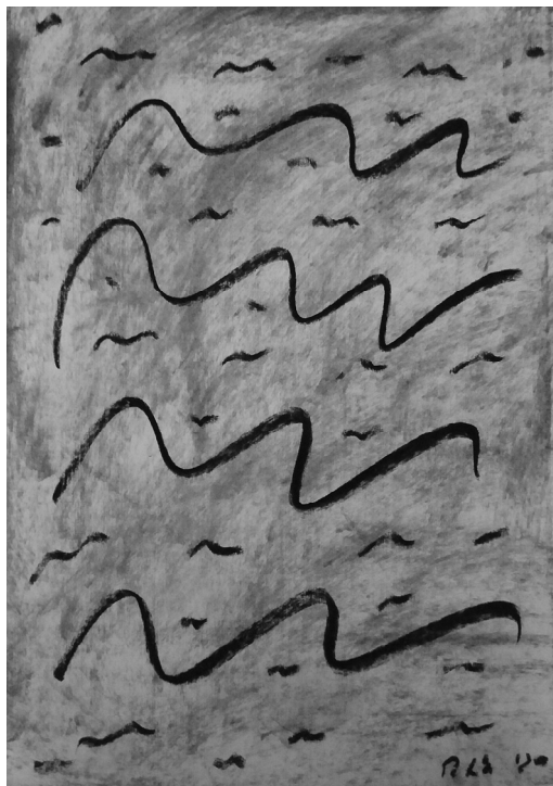
PETŐCZ ANDRÁS MADARAK - TANDORINAK (KÁOSZ 2.)

Azonban a kötet – társadalmi–történeti–politikai–kulturális beágyazottságából fakadóan – mintha mindenekelőtt irodalmon kívüli funkciókat látna el. Jelentősége nem feltétlenül esztétikai jellegű. A szakállas Neptun nem tartogat mást, mint amit már a borító és a fülszöveg is elárul: „Nádasdy Ádám novelláiból megtudhatjuk, milyenek a melegek: éppen olyanok, mint bárki más.” A derekasan megírt novellák szépirodalmi értékét leginkább a frappáns párbeszéd; a szerző már jól ismert, eredeti stílusa; az ügyeskezdő szerkesztés és egy-egy pazarul sikerült metafora teremti meg. Ám a méltányos olvasó nem tekinthet el attól az esztétikai-ideológiai kettősségtől sem, mely a kisebbségi irodalmakat gyakran jellemzi. Ahogy a szerzőre rendkívül emlékeztető elbeszélő fogalmaz a Haladási napló című novellában: „Nincs most kedvem logikai feladatokhoz, mondja, ne taníts. Ritkán mondja ezt, hogy »ne taníts«, de akkor fáj. Mi mást csinálnék?” (72)