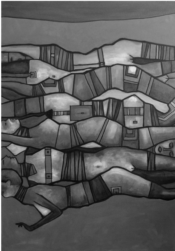
Eltűnt idő nyomában 1. olaj, vászon, 100×70 cm, 2019.