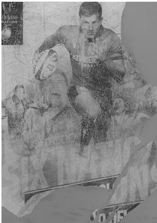
A KÉPMUTATÓK 10.

A Komédia első részének közzététele, továbbá a Purgatórium és a Paradicsom rövid időn belül várható megjelenetése Dante halálának vagy inkább halhatatlanságának 700. évfordulójára a magyar tudomány méltó tisztelgése a világirodalom egyik legnagyobb költője előtt.