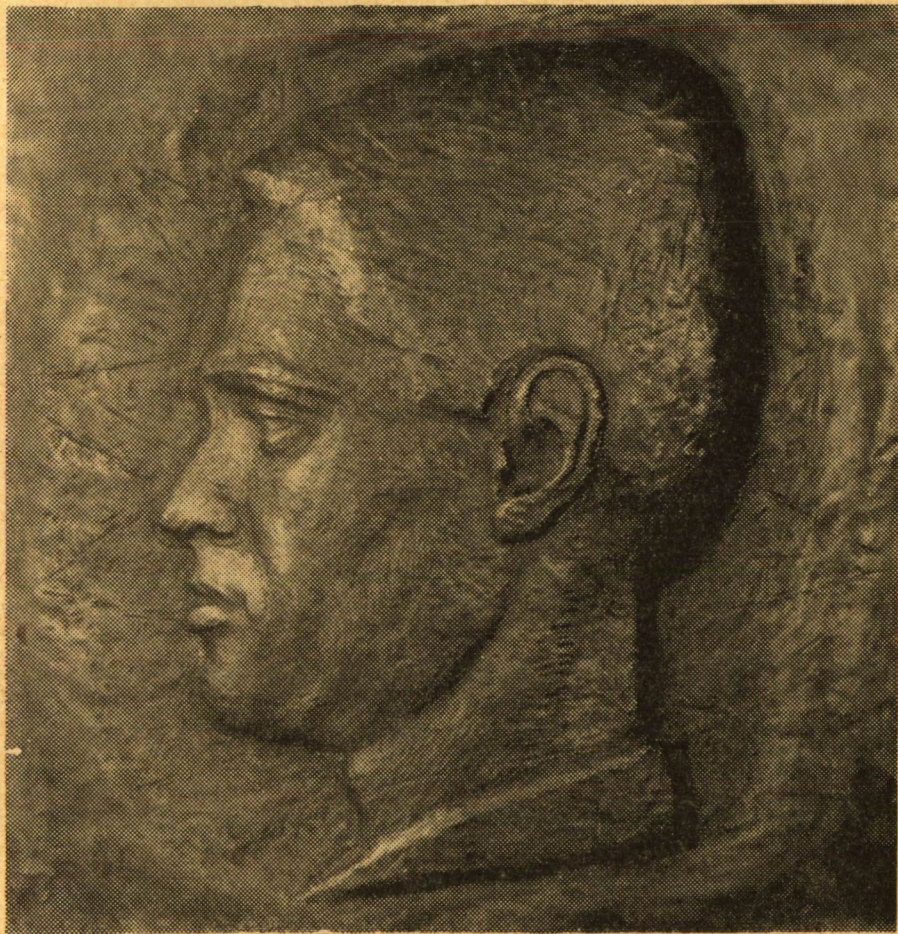
Tóth Sándor: Önarckép

kat és időtlen emberi érzéseket fejeznek ki. Ilyen — többek között — egyik legutóbbi műve, az Új hajítás. Tavalyi munkái közül a Család II. c. reliefje mondható legsikerültebbnek. Téglány alakú lemezén biztos arányérzékkel szerkesztette meg az apa, anya és a gyermek egymás iránti szeretetüktől összeforrott