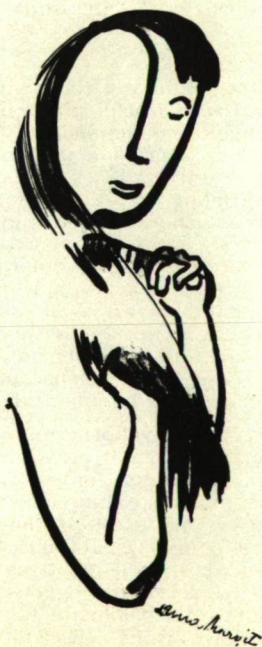
Anna Margit: Fésülködő