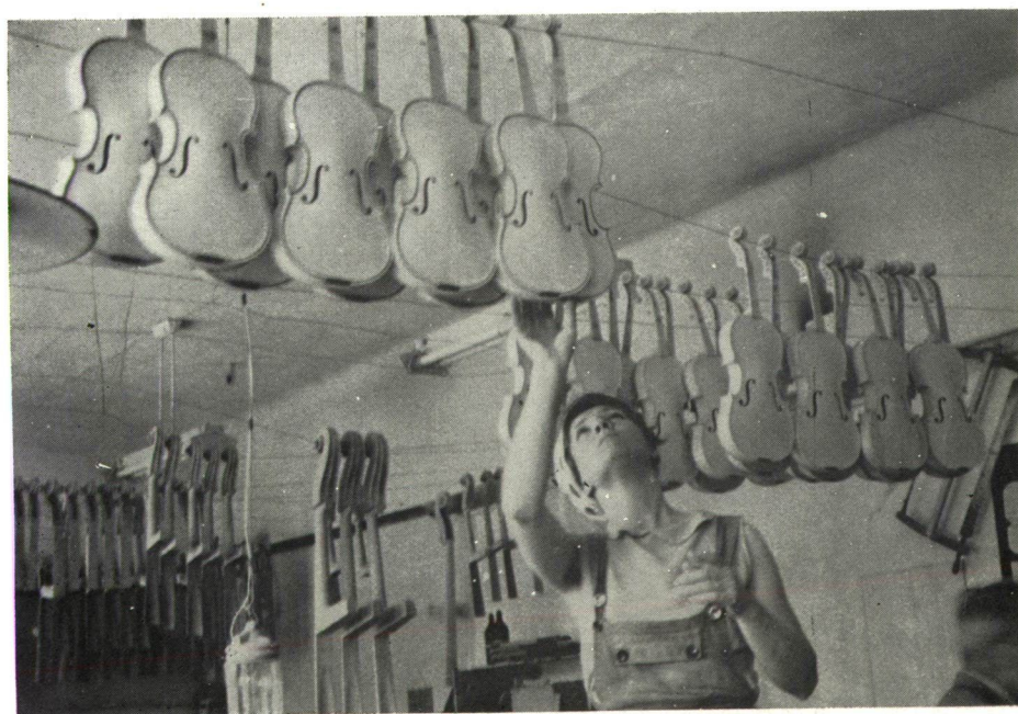
Hegedűk — lányok