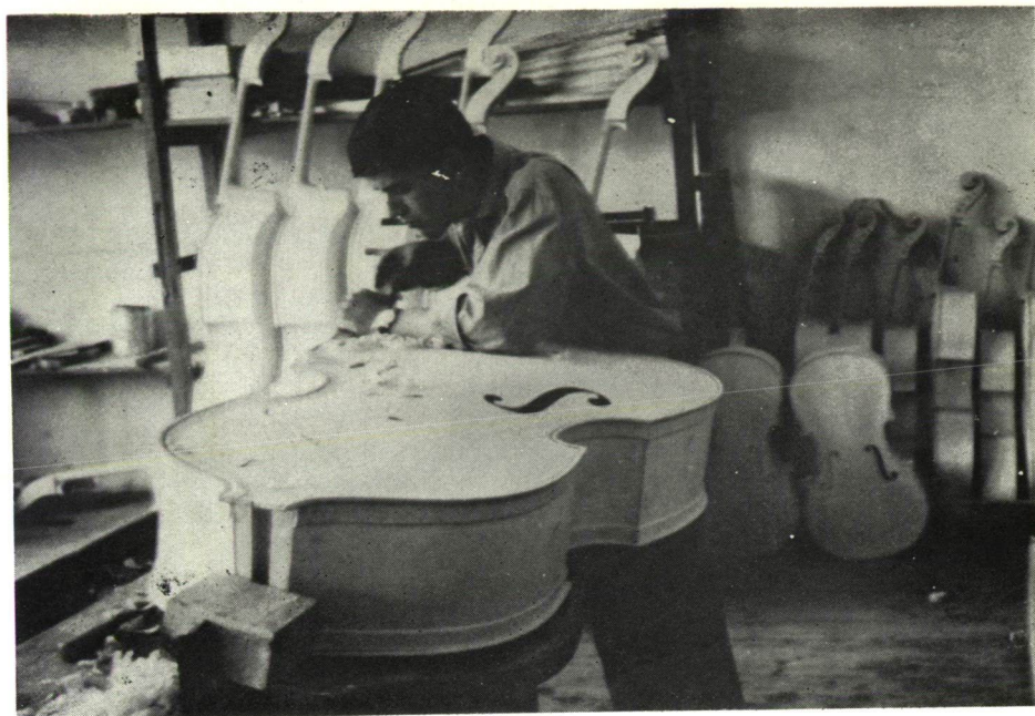
A bögő „körülpucolása”