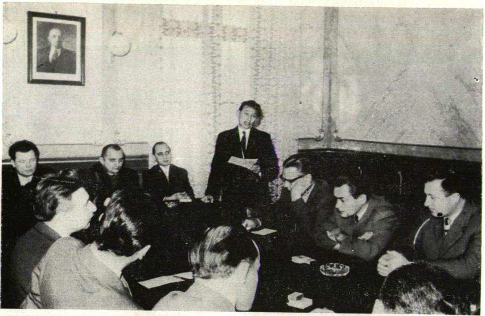
Bács, Békés és Csongrád megye íróinak szegedi találkozója (1962). Fogadás a tanácsházán