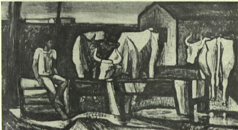
Dér István: Itatás