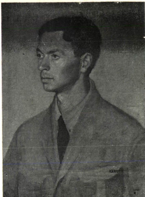
Károlyi Lajos: Férflarcckép

menő önarcképein és kedvelt virágbrázolásain kívül odaadással festegette a kertvárossá fejlődő Újszeged egy-egy hangulatos részletét vagy a régi Szeged víz előtti utcáit, hogy sajátos szépségüket lírai színekkel megörökítse. Portréi és különböző tanulmányfejei igazolják, hogy a realista emberbrázolás Károlyi festészetének egyik legfontosabb értéke. Első gyűjteményes kiállítását a szegedi múzeumban, 1910-ben rendezte meg, majd nyolc évvel később, 1918 őszén a Nemzeti Szalóban mutatkozott be, ahol sikere volt. A tehetséges vidéki festőt ezután szívesen fogadták be a fővárosi Képző- és Iparművészek Egyesületének tagjai közé. Sőt a Szépművészeti Múzeum a Falurészlet, a Virágcsendélet és a Folyópart c. alkotásait megvásárolta.