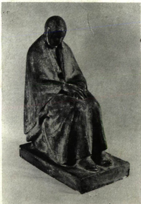
Vigh Ferenc: Ülő asszony

lyos állapotokra az olyan riportok is rávilágítanak, amelyek — többek között — ezt állapították meg: „...a szegedi festőművészek vallomásaiból kiderült, hogy sajnos a művésznyomor frontján a helyzet változatlan.” E tény hitelességét — mások mellett — Papp Gábor (1872—1931), és Cs. Joachim Ferenc (1881—1958) itteni festők, valamint Vigh Ferenc (1881—1949) helyi szobrászművész életútja is igazolta. Munkásságuk során egyikük sem kapott tehetségéhez méltó elismerést. Cs. Joachim és Vigh a vidékiesség elől Franciaországba menekültek. Később hazatértek Szegedre és megélhetésükért sokat küzdöttek. Társuk, az itthon maradt Papp Gábor időközben olyan nyomorba került, amelyet idegileg nem tudott elviselni és tragikus módon zártintezetben halt meg. Mint Székely Bertalan egykori tanítványa, főleg barna tónusú realista portrékat és valóságelvű természetábrázolásokat, városrésztleteket fes-