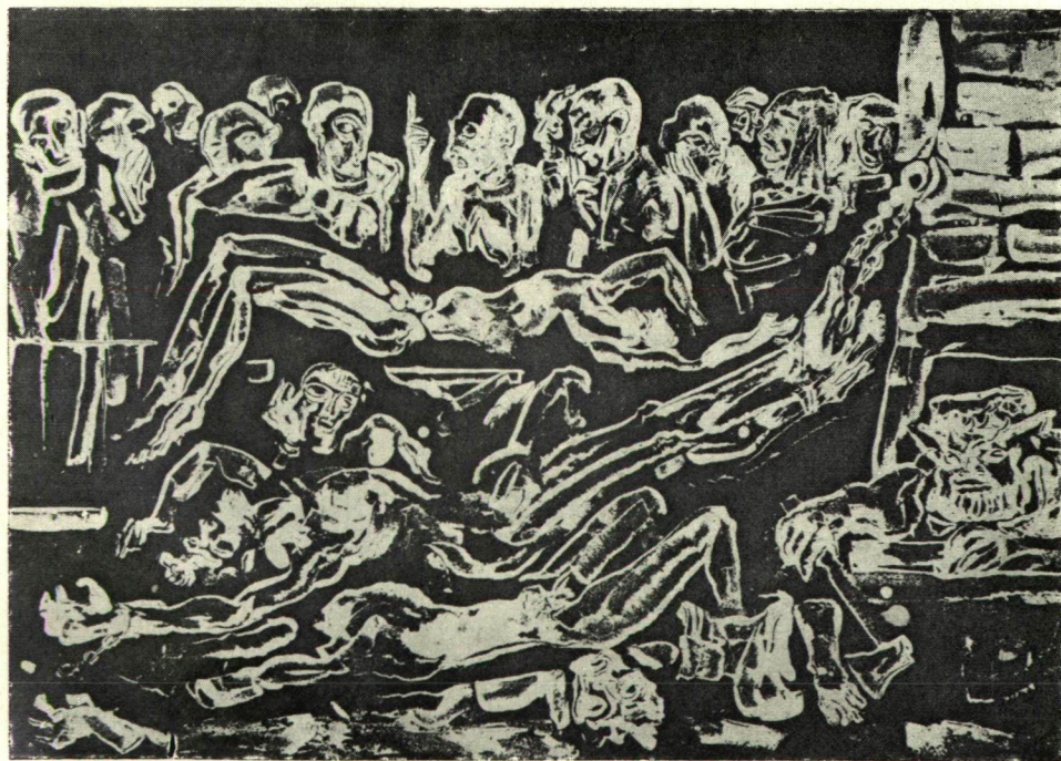
VINKLER LÁSZLÓ: PROKRASZTÉSZ DOKTOR ANATÓMIÁJA