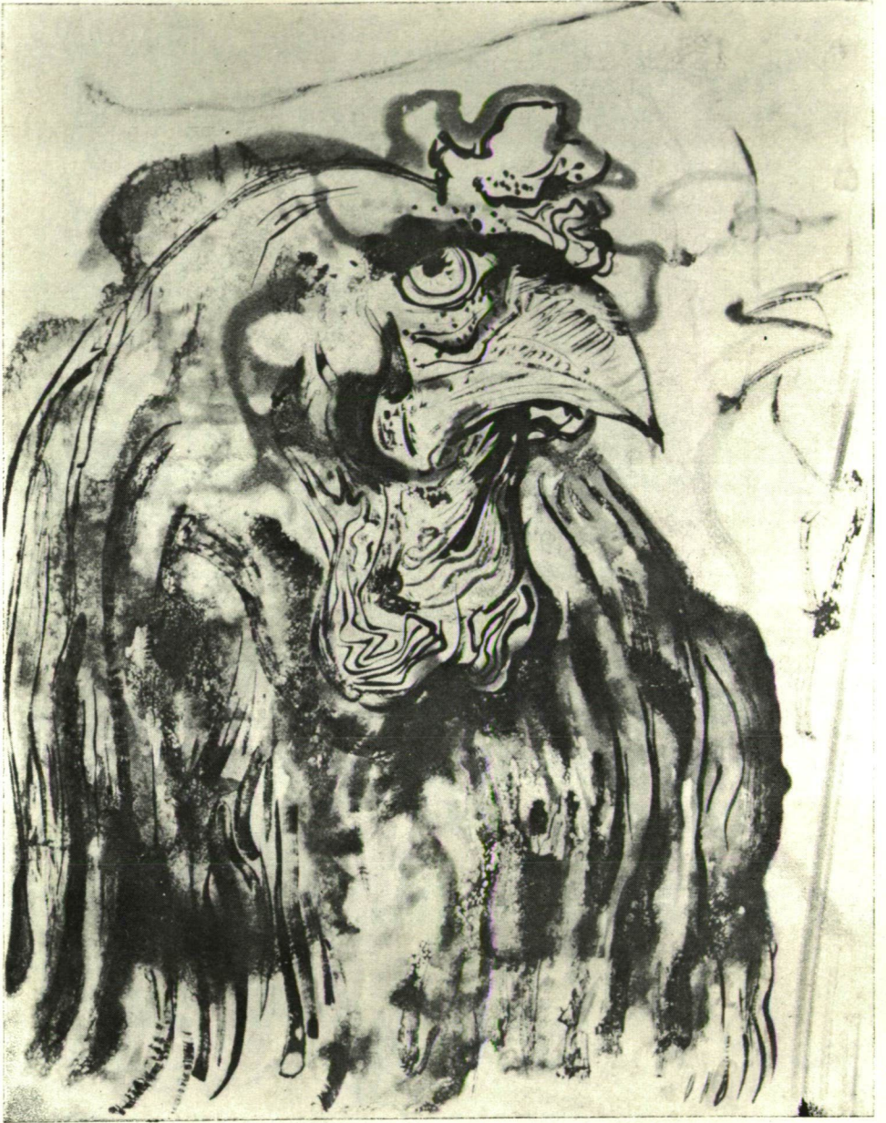
EDOUARD PIGNON: KAKAS