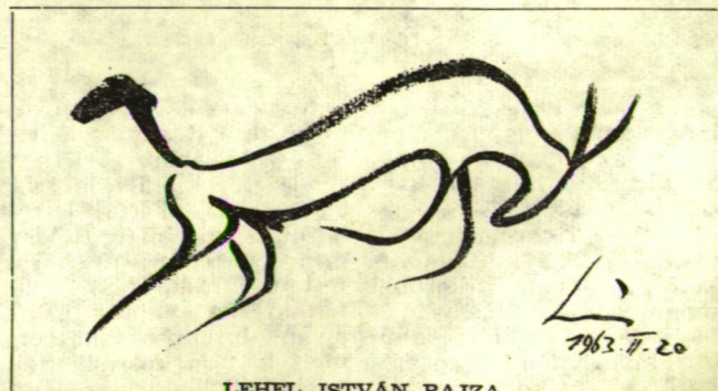
LEHEL ISTVÁN RAJZA