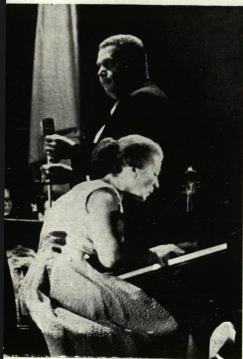
FISCHER ANNIE ÉS LEHEL GYÖRGY

GEDI SZABADTÉRI JÁTEKOK FELÚJÍTÁSÁT, KULTÚRPOLITIKAI FONTOSSÁGÁT IS JELENFŐSNEK TARTOM. MOST, HOGY SZEGED ÚJRA MEGRENDEZI A SZABADTÉRI JÁTEKOKAT, ÚGY HISZEM, RÖVIDESEN A „MAGYAR SALZBURG”-KÉNT EMLEGETIK ISMÉT AZOK, AKIK MÁR A RÉGI JÁTEKOKAT MEGSZERETTEK...”