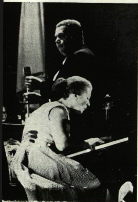
FISCHER ANNIE ÉS LEHEL GYÖRGY

GEDI SZABADTÉRI JÁTEKOK FELÚJÍTÁSÁT, KULTÚRPOLITIKAI FONTOSSÁGÁT IS JELENFŐSNEK TARTOM. MOST, HOGY SZEGED ÚJRA MEGRENDEZI A SZABADTÉRI JÁTEKOKAT, ÚGY HISZEM, RÖVIDESEN A „MAGYAR SALZBURG”-KÉNT EMLEGETIK ISMÉT AZOK, AKIK MÁR A RÉGI JÁTEKOKAT MEGSZERETTEK...”