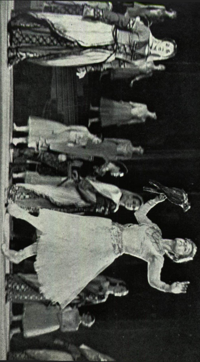
TORADZE: GORDA - A GRÜZ BALETTEI ENŐADÁSÁBAN