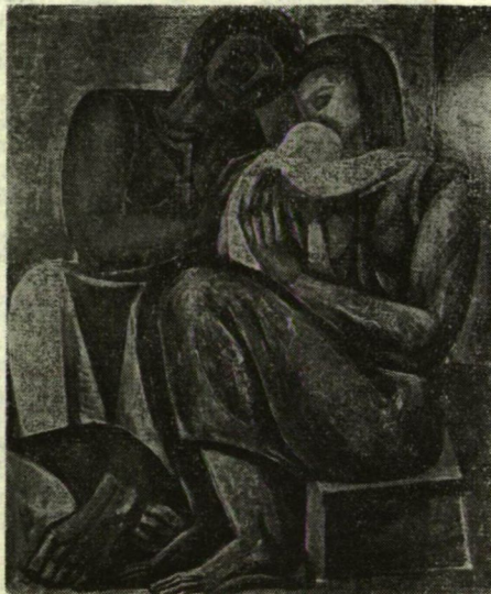
ZOMBORI LÁSZLÓ: CSALÁD