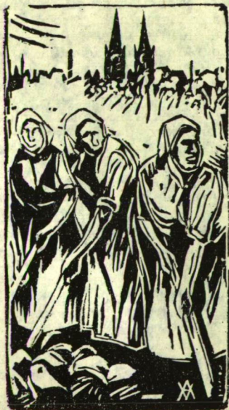
VINCZE ANDRÁS FAMETSZETE

Az 1914-ben, Feleden született művész próbálkozásaira Rudnay figyelt fel elsőként, Vincze 1947-ben, Baján rendezett, önálló kiállításán. Rudnay